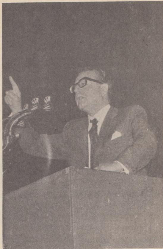
El Compañero Presidente, Dr. Salvador Allende en instantánea característica.

Quiero tan sólo recordar que el primer proyecto de ley que presentara como Diputado por Valparaíso, en 1937 fué un proyecto destinado a la alfabetización obrera y campesina, y que, para financiarlo, ponía un impuesto al hierro exportable. Como era de imaginarse en un Congreso con mayoría que no era de