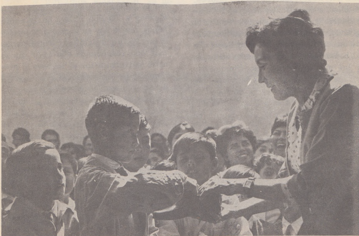
La Primera Dama, Señora Hortensia Bussi de Allende, contribuye a la entrega de calzado a escolares, la cual estará a cargo de la Junta de Auxilio Escolar y Becas.

De allí, que junto con destacar la significación que tiene para nosotros el